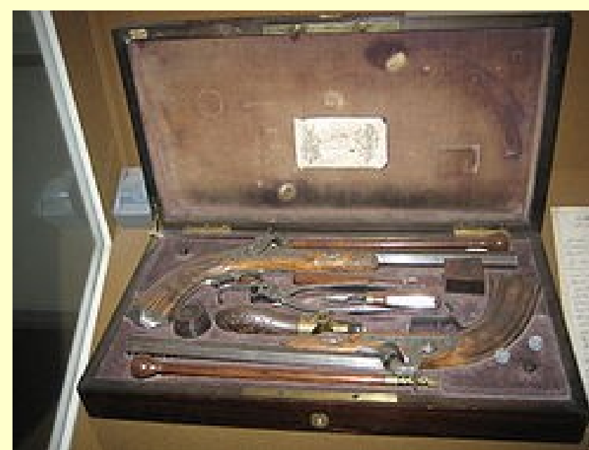
Дуэльные пистолеты времен Пушкина