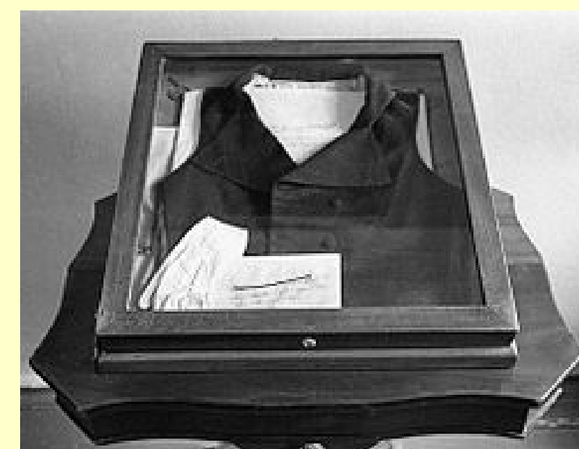
Жилет, в котором Александр Сергеевич стрелялся на дуэли.

По подсчётам пушкинистов столкновение с Дантесом было как минимум 21 вызовом на дуэль в жизни поэта. Он был инициатором 15 дуэлей, из которых состоялись 4, остальные не состоялись ввиду примирения сторон, в основном стараниями друзей Пушкина; в 6 случаях вызов на дуэль исходил не от Пушкина, а от его оппонентов.