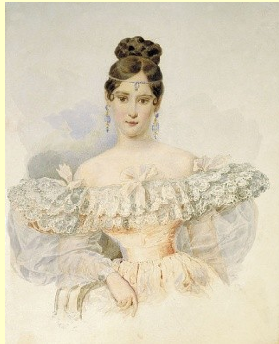
Наталья Николаевна Гончарова

Александр Сергеевич Пушкин родился 26 мая 1799 в Москве, а был убит 29 января 1837 в Санкт-Петербурге во время дуэли между им и Дантесом. Он кроме русским поэтом был драматургом и прозаиком.