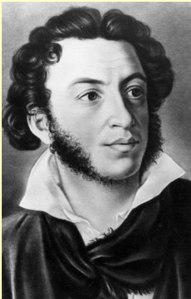
А. С. Пушкин

Александр Сергеевич Пушкин родился 26 мая 1799 в Москве, а был убит 29 января 1837 в Санкт-Петербурге во время дуэли между им и Дантесом. Он кроме русским поэтом был драматургом и прозаиком.