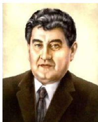
Виктор Петрович Астафьев