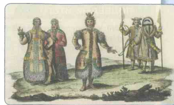
Якуты. Рисунок XIX в.

Одним из наиболее многочисленных народов Северо-Восточной Сибири в XVII в. были якуты ( сахá ). Говорили они на тюркском языке. Это были скотоводческие племена. В отличие от других народов этого региона они заготавливали на зиму сено для скота, умели делать из молока творог и сыр. У якутов было развито рыболовство. Охота на пушного зверя была одним из подсобных видов промысла. Развивалось у якутов кузнечное и гончарное ремесло. Жилище якутов представляло собой объединённые под одной крышей жилое помещение — юрту и хлев для скота — хотон . Основу такого жилища составлял каркас из вертикальных деревянных опорных столбов и балок-перекрытий, а стены и крыша делались из тонких брёвен, плотно пригнанных друг к другу. Снаружи дом обмазывался глиной, смешанной с навозом, а сверху утеплялся землёй. Брёвна крыши покрывали корой, поверх которой также набрасывали землю. Небольшие окна затягивали рыбьим пузырьём, слюдой или бумагой, а зимой закрывали поверх толстыми льдинами.