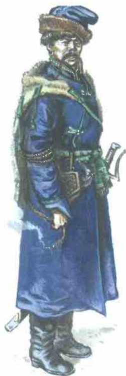
Пеший реестровый казак XVII в. Современный рисунки

в брак или получении наследства крестьянин должен был заплатить своему хозяину налог. Крестьян принуждали молотить хлеб только на господской мельнице, пользоваться только господской кузницей и т. д. Особенно тяжёлым было положение крестьян в имениях, которые польские и литовские дворяне сдавали в аренду купцам или ростовщикам. Стремясь в кратчайший срок с лихвой возместить затраченные средства, арендатор заставлял крестьян работать почти без отдыха, а нередко и опустошал крестьянские хозяйства. Невыносимые и унижающие условия труда заставляли крестьян бежать от помещиков. Чтобы предотвратить бегство крепостных, землевладельцы часто посылали их на работу в кандалах и неделями не отпускали из имений.