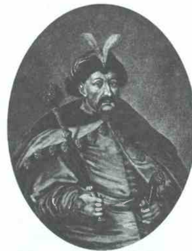
Богдан Хмельницкий. Гравюра XVII в.

Хмельницкий понимал, что без поддержки извне освободиться от польской зависимости невозможно. Союз с Крымским ханством оборачивался пленени-