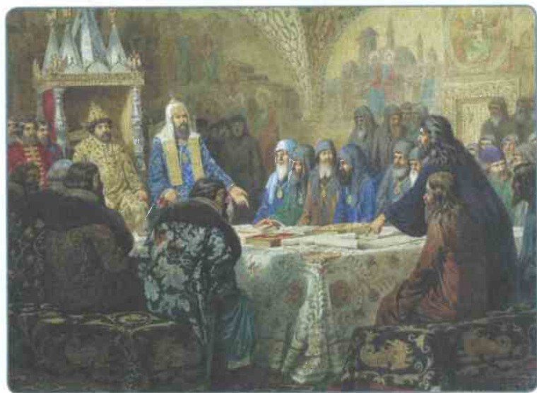
Патриарх Никон предлагает новые богослужебные книги. Художник А. Д. Кившенко

Новый патриарх был человеком своенравным и волевым. Получив огромную власть над верующими, Никон вскоре выступил с идеей первенства церковной власти над царской и, по существу, предложил Алексею Михайловичу разделить с ним власть по примеру царя Михаила Фёдоровича и патриарха Филарета.