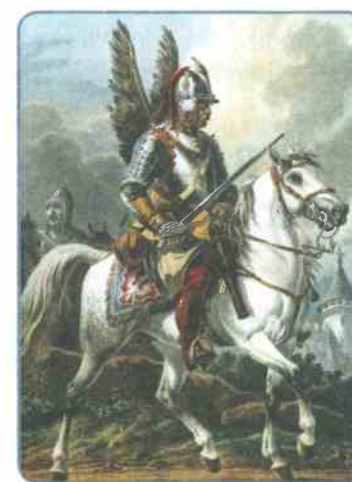
Польский всадник в рыцарских латах. Художник А. О. Орловский