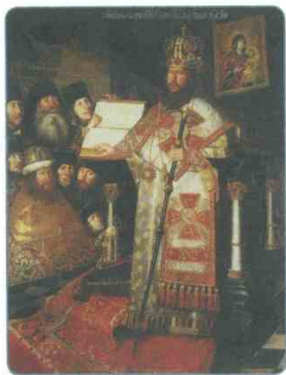
Патриарх Никон с братией Воскресенского монастыря. Парсуна XVII в.