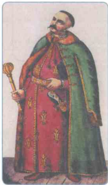
Казацкий полковник. Рисунок XVIII в.

войско. Независимой остались судебная и финансовая системы.