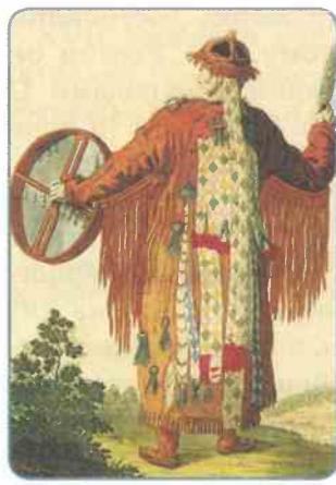
Бурятская шаманка. Рисунок XVIII в.