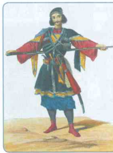
Имеретинский князь. Рисунок XIX в.