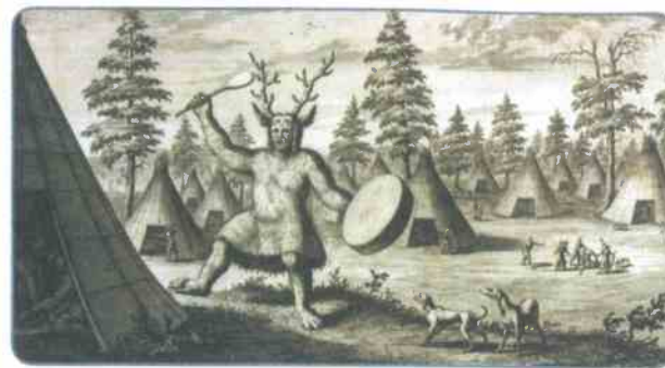
Тунгусский шаман. Рисунок XVII в.