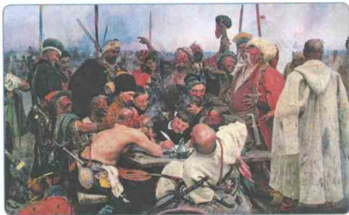
Запорожцы. Художник И. Е. Репин

Первенствующее положение в Речи Посполитой занимала шляхта, обладавшая огромными привилегиями и правами. Эти привилегии и права привлекали православных князей и дворян, живших на польских и литовских землях. Однако они распространялись только на дворян-католиков, поэтому часть знати переходила из православия в католичество. Вместе с верой она перенимала польский язык и культуру.