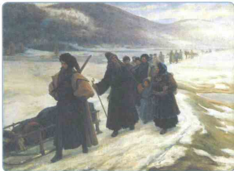
Путешествие Аввакума по Сибири. Художник С. Д. Милорадович

которое время Аввакум входил в число членов кружка ревнителей благочестия. Его участники стремились к исправлению церковной и светской жизни в России путём утверждения благочестия на основе строгого следования церковным уставам и постановлениям Стоглавого собора 1551 г. Именно там он познакомился с поддерживавшим кружок царём Алексеем Михайловичем.