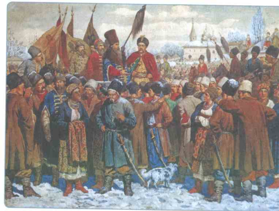
Переяславская рада. Художник А. Д. Кившенко

Богдан Хмельницкий обращался за поддержкой и в Стамбул, и в Москву. Помощь запорожскому казачеству означала войну с Речью Посполитой, и царь Алексей Михайлович долго колебался в вопросе поддержки Хмельницкого. Только в 1653 г. Земский собор постановил: принять земли Войска Запорожского в подданство российского государя и «против польского короля войну вести».