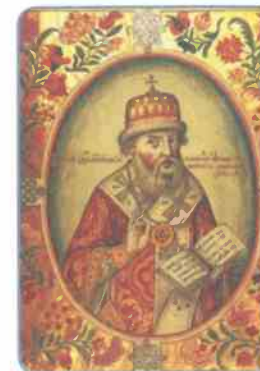
Патриарх Филарет. Миниатюра XVII в.

Мнения верующих разделились. Одни (в том числе патриарх Иосиф) предлагали исправить церковные книги и обряды, вернувшись к древнерусским образцам. Другие (к числу которых относился царь Алексей Михайлович и его ближайшее окружение) считали, что следует обратиться не к книгам столетней давности, а к самим греческим источникам, с которых они в своё время переписывались.