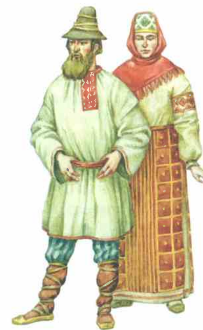
Крестьянин с крестьянкой. Современный рисунок

Левобережье Днепра и Киев вошли в состав России при условии сохранения самоуправления. Москва осуществляла управление этими территориями через гетмана, который возглавлял 60-тысячное запорожское казачье