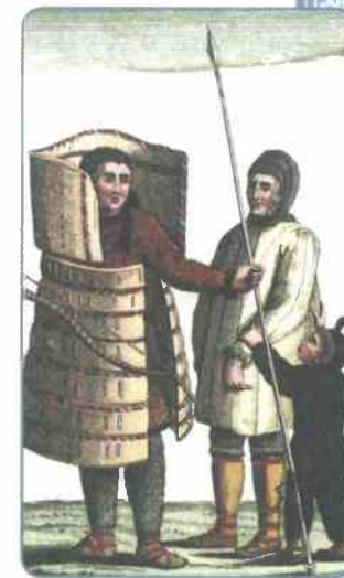
Чукотский воин с женой и сыном. Рисунок XIX в.

В Приамурье жили племена дау́ров , на развитие которых большое влияние оказала китайская цивилизация. Основным их занятием было земледелие (сеяли рожь, пшеницу, овёс, ячмень, просо, гречиху, коноплю, горох). Дауры умели получать растительное масло, занимались огородничеством и садоводством. Кроме лошадей, коров и овец, они держали также свиней и кур. Охота и рыбная ловля были подсобными занятиями. Дауры строили города, защищённые от нападения неприятеля рвами, стенами и башнями.