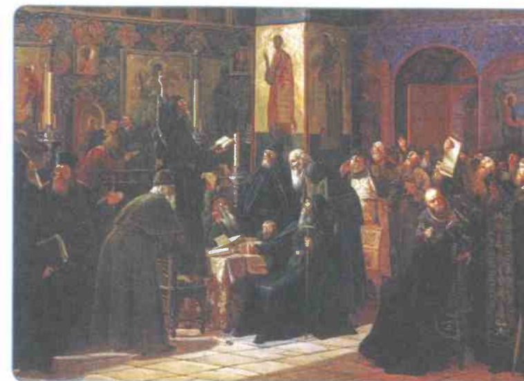
Чёрный собор. Восстание Соловецкого монастыря против новопечатных книг в 1666 г. Художник С. Д. Милорадович

Крупнейшими вооружёнными выступлениями борцов за старую веру были Соловецкое восстание 1668—1676 гг., движение раскольников во время Московского восстания 1682 г., выступление на Дону в 1670—1680-х гг.