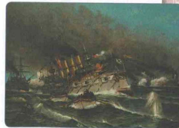
Чемульпо. Крушение «Варяга» и «Корейца»

Японский план войны предусматривал в качестве основной задачи добиться превосходства на море. Её решение гарантировало успех операций по высадке десанта на суше и последующему захвату территорий Маньчжурии, Приморского и Уссурийского краёв.