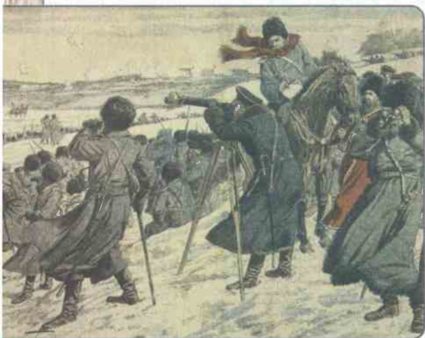
Эпизод сражения под Мукденом

В ответ японцы активизировали свои действия в районе Порт-Артура. Героизм, мужество, упорство русских защитников вызывали восхищение даже у японцев. В декабре погиб начальник сухопутной обороны крепости талантливый генерал Р. И. Кондратенко. Командующий войсками генерал А. М. Стессель созвал Совет обороны крепости. Большинство членов