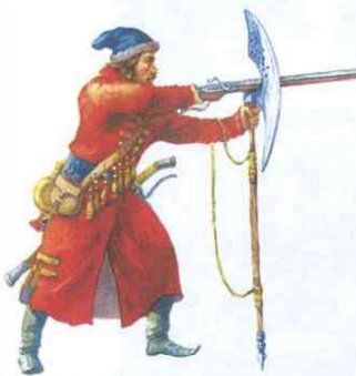
Стрелец. Современный рисунок. Сравните вооружение стрельца с вооружением европейского воина, изображённого на иллюстрации на с. 25.

В 1550 г. была проведена военная реформа . На время военных действий ограничивалось местничество — на высшие военные должности назначали лица, проявившие воинский талант, независимо от знатности рода. Была создана избранная тысяча — ядро поместного ополчения, непосредственно подчинённое царю. Первой попыткой создания регулярной армии стало учреждение стрельцких полков . Стрельцом мог стать любой свободный человек.