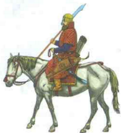
Всадник поместной конницы XVI в. Современный рисунок

Образование единого Российского государства имело большое положительное значение как для экономического развития вошедших в его состав земель, так и для их защиты от нападения соседей.