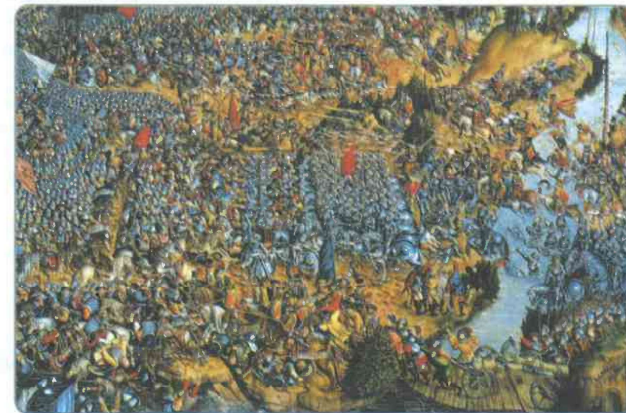
Сражение под Оршей. Картина неизвестного художника XVI в.

На Балтике Россия вела борьбу с Ливонским орденом. В 1501—1503 гг. разгорелась русско-ливонская война . Союзники Ливонского ордена — литовцы и ганзейские купцы устроили торговую блокаду России, запретив ввозить в неё необходимые товары (прежде всего цветные металлы и серебро) из Европы. Активная внешняя политика Москвы привела к регулярно направляению послов не только в соседние, но и в дальние европейские