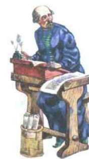
Приказный дьяк. Современный рисунок