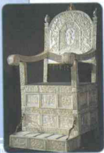
Костяной трон царя Ивана IV

Каково было значение венчания Ивана IV на царство?