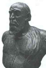
Иван IV. Реконструкция М. М. Герасимова