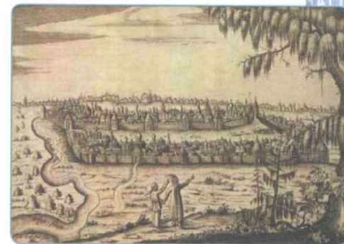
Казань. Рисунок Адама Олеария. XVII в.

Большую роль в государстве играло мусульманское духовенство. Оно имело огромное влияние на принятие ханом