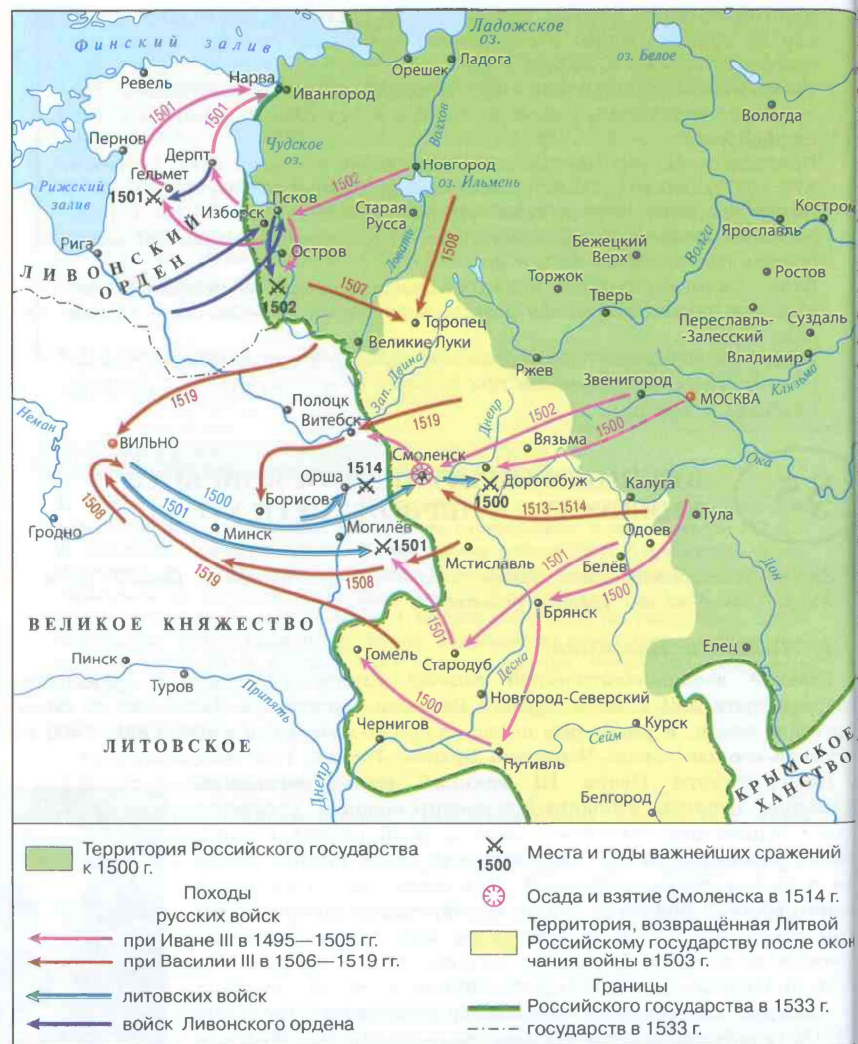
Русско-литовские войны в начале XVI в.

Торопец и Дорогобуж. В октябре 1508 г. был заключён мир: Литва признала все прежние завоевания Московского княжества, совершённые Иваном III. Земли мятежных князей Глинских остались в составе Великого княжества Литовского (сами князья Глинские, переселившись в Россию, поступили на службу к Василию III).