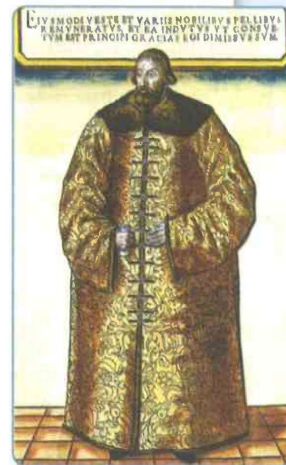
Сигизмунд фон Герберштейн в кафтане, пожалованном ему великим князем Московским Василием III Ивановичем в 1517 г. Гравюра XVI в.