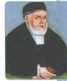
Сигизмунд I. Художник Л. Кранх Младший

После смерти Ивана III великий князь литовский Сигизмунд Ягеллон, избранный польским королём, заключил союз с Крымским ханством, направленный против Российского государства. В 1507 г. литовский сейм принял решение о начале войны с Россией. Литовские войска разорили черниговские и брянские земли; одновременно крымские татары совершили набег на южные русские земли. Однако в Великом княжестве Литовском начался мятеж князей Михаила и Василия Глинских, которые признали себя вассалами Василия III. Этим воспользовался российский государь. В 1508 г. войско Василия III осадило города Оршу, Минск и Слуцк (однако взять их не удалось). Войско великого князя литовского не смогло удержать захваченные русские города