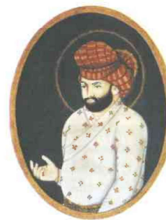
Бабу́р. Миниатюра XVI в.

После похода на Казань в 1487 г. Иван III поставил во главе ханства Мухаммед-Эмина. Государь всея Руси также держал у себя на службе татарских «царевичей» для того, чтобы в случае необходимости выдвинуть их в качестве претендентов на казанский престол. В России эти «царевичи» получили целые области (например, Касимовское «царство»), где расселились со своим двором. Казанское ханство оставалось вассалом Москвы до смерти Ивана III. С начала XVI в. ситуация изменилась: крымские и казанские татары возобновили набеги на русские окраины. В 1521 г. впервые за много лет крымский хан Мухаммед-Гирей прорвался с войском к Москве и взял огромный полон. Хан остановился за несколько вёрст от Москвы, его послы потребовали выплаты дани. Москвичи привезли хану грамоту великого князя с обязательством платить дань. Но когда татары, ссылаясь на волю великого князя,