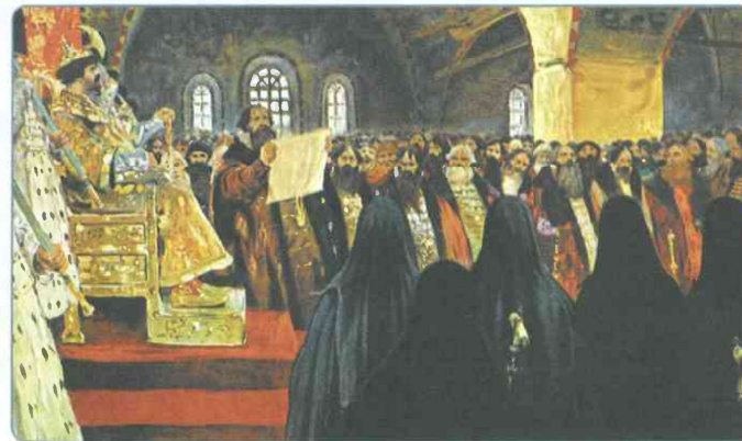
Земский собор. Художник С. В. Иванов

В 1550 г. на Земском соборе был утверждён новый Судебник . В нём был увеличен размер пожлого при переходе крестьян (в Юрьев день) от одного помещика к другому, ужесточались наказания для разбойников, вводились наказания за взятки, ограничивались права наместников. Судебник наделял Боярскую думу правом высшего законосовещательного органа при царе. Все законы должны были проходить порядок боярского приговора (утверждения).