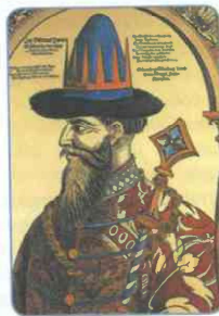
Иван IV. Гравюра XVI в.

Регентство Елены Глинской продолжалось менее пяти лет (1533—1538).