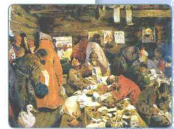
В Приказе московских времён. Художник С. В. Иванов