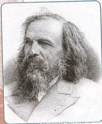
Д. И. Менделеев

Научные открытия изменили картину мира. Немецкий физик Г. Герц в 1889 г. доказал существование электромагнитных волн, В. Рентген в 1895 г. обнаружил лучи, которые представляли собой коротковолновое электромагнитное излучение (позднее они получили название рентгеновских). Изучение их природы привело англичанина Дж. Дж. Томсона к открытию первой элементарной частицы — электрона. Французский физик А. Беккерель в 1896 г. открыл эффект радиоактивности. Э. Резерфорд показал неоднородность радиоактивного излучения, состоявшего из альфа-, бета-, гамма-лучей, в 1911 г. он построил планетарную модель атома.