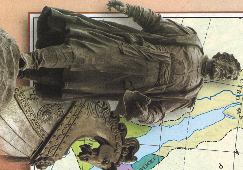
Памятник Афанасию Никитину. Тверь