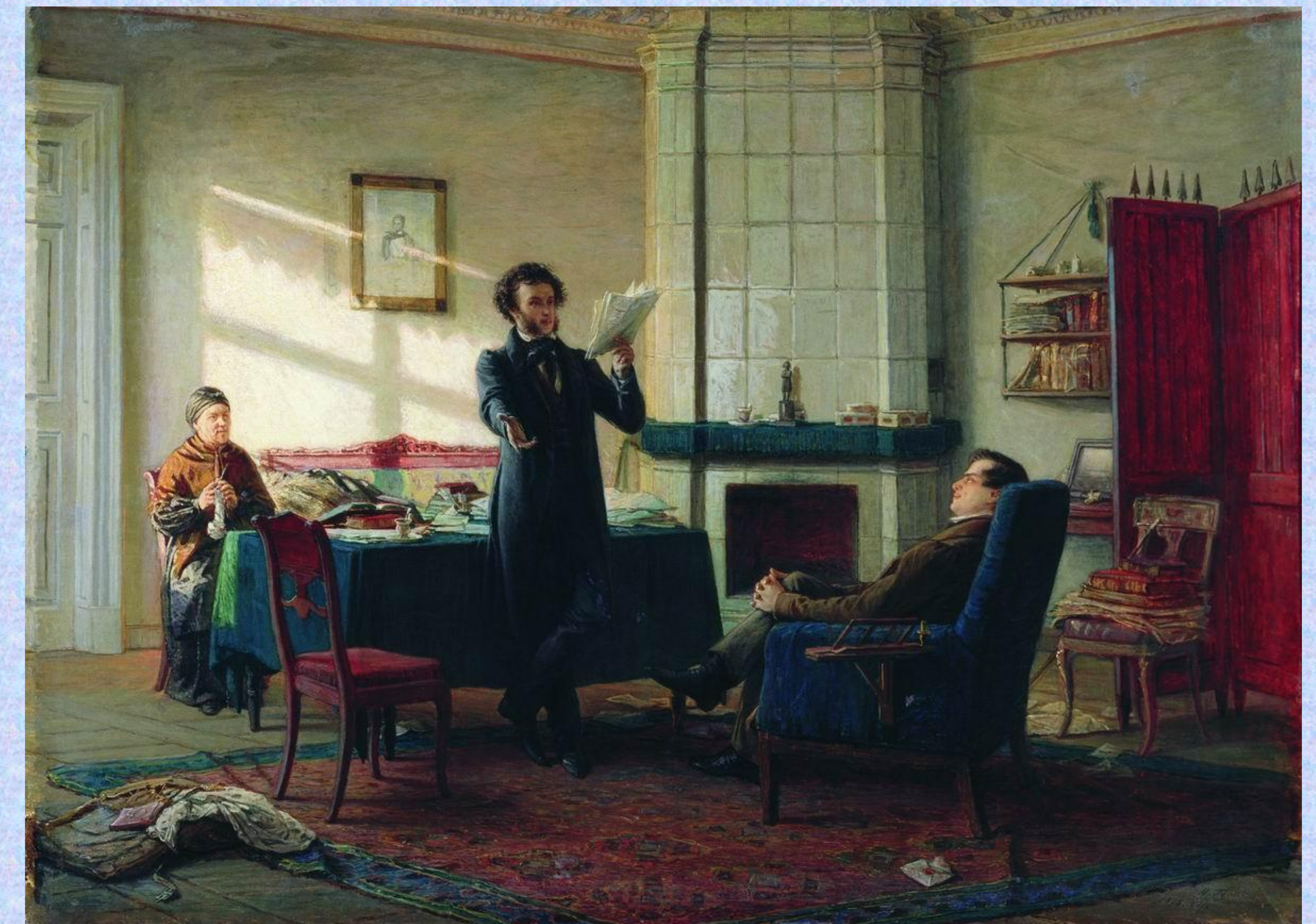
А.С.Пушкин со своим другом И.Пушкиным и няней Ариной Родионовной в Михайловском

Ты под окном своей светлицы Горюешь, будто на часах, И медлят поминутно спицы В твоих наморщенных руках.